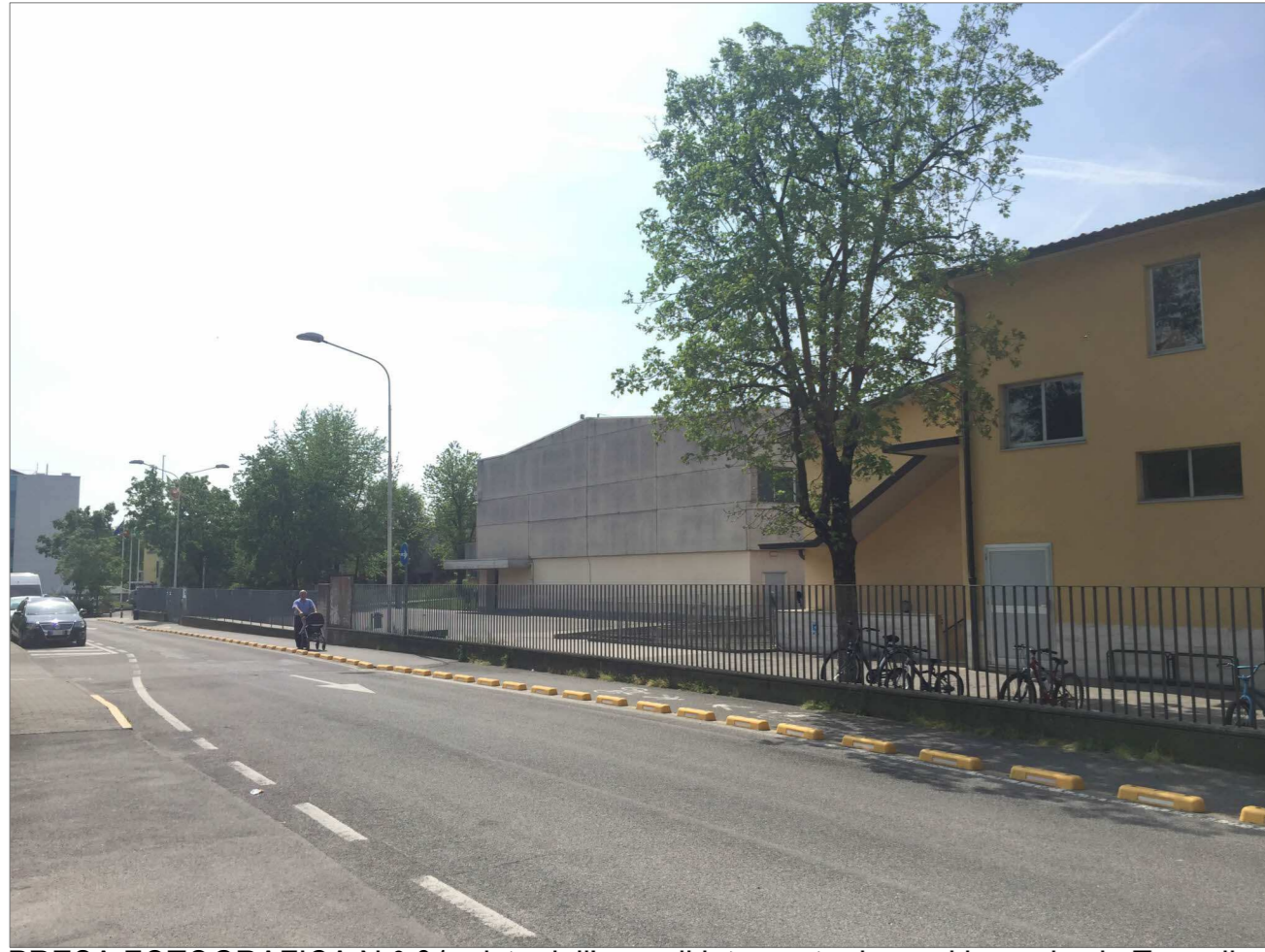
PRESA FOTOGRAFICA N.° 01_vista dell'area di intervento da nord lungo la via Tognoli