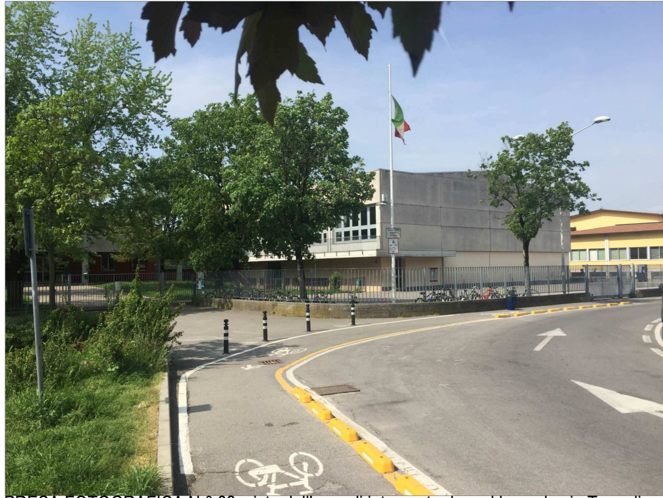
PRESA FOTOGRAFICA N.° 03_vista dell'area di intervento da sud lungo la via Tognoli