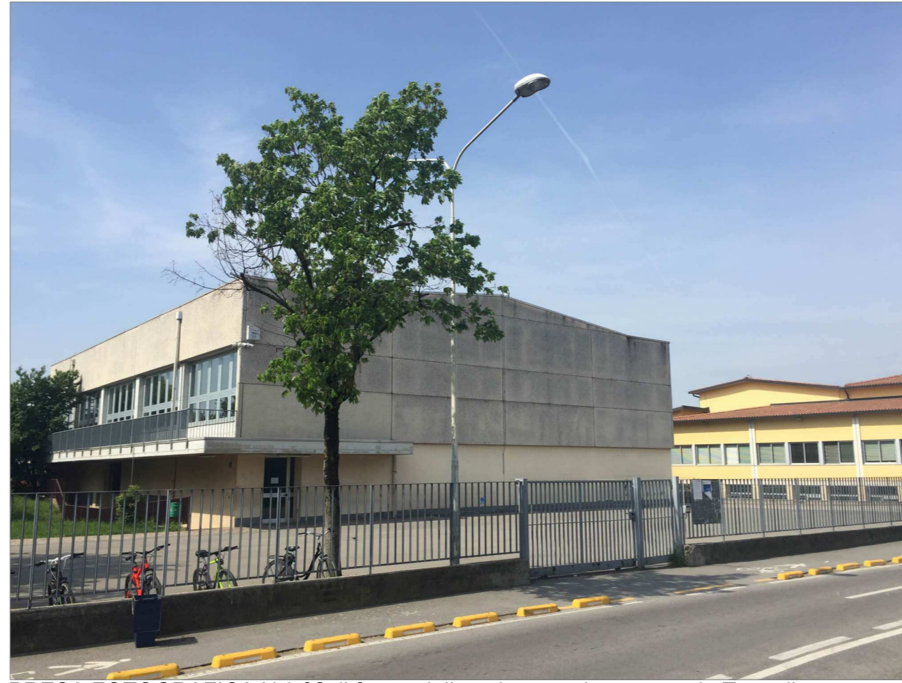
PRESA FOTOGRAFICA N.° 02_il fronte della palestra esistente su via Tognoli