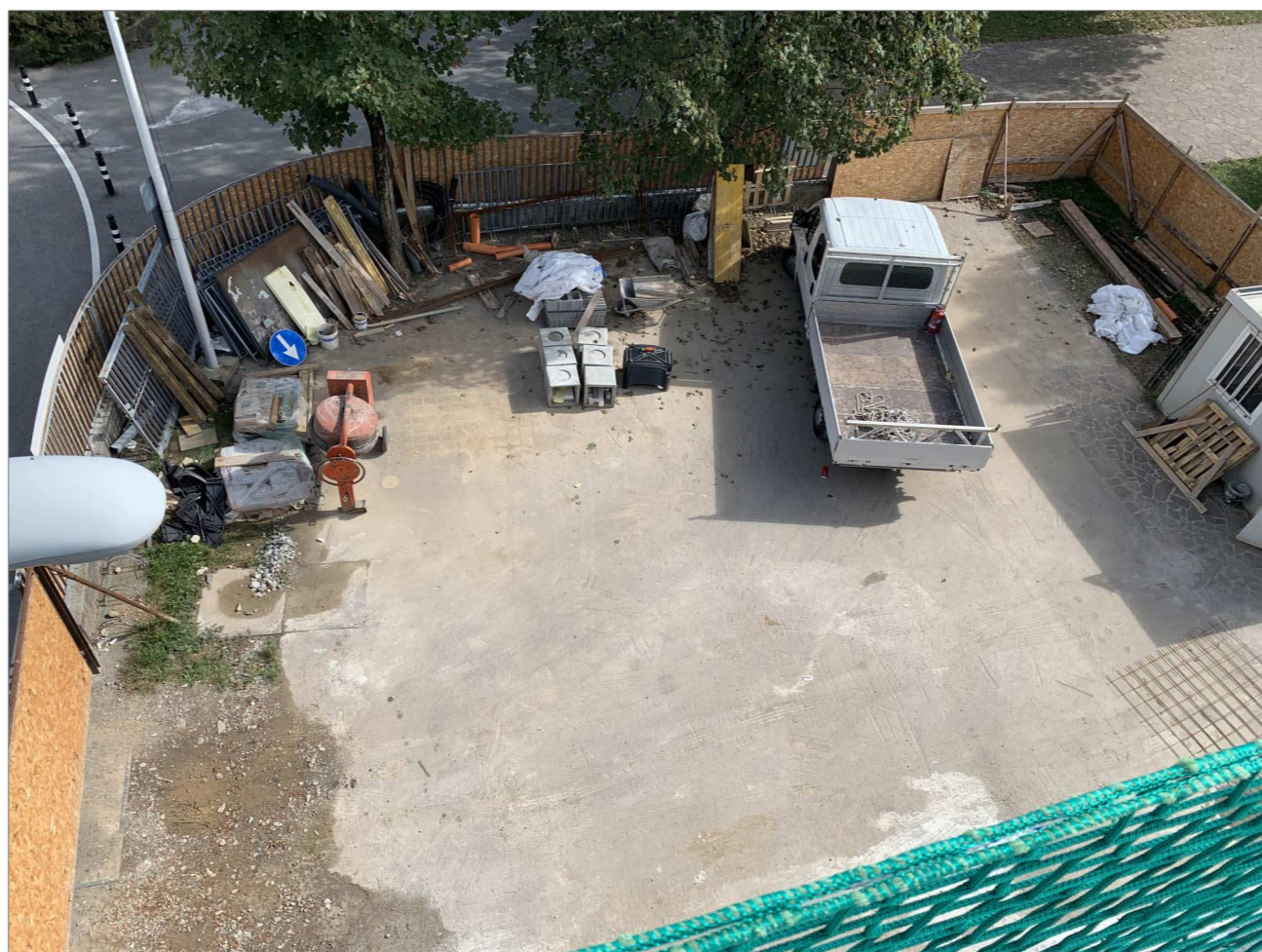
PRESA FOTOGRAFICA N.° 06_l'area di intervento vista dalla copertura dell'ampliamento della attuale palestra comunale

via furietti snc 24126 bergamo +390354226476 mminelli@lab-4.it marco.minelli@archiviomines.it MINELLI ARCHITETTI ASSOCIATI p. IVA 02933510162