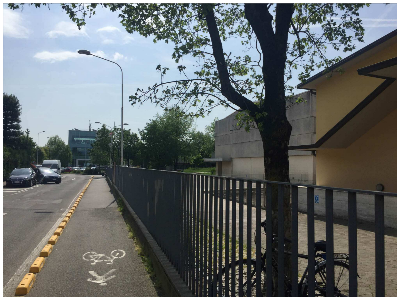
PRESA FOTOGRAFICA N.° 05_la pista ciclopedonale lungo la via Tognoli