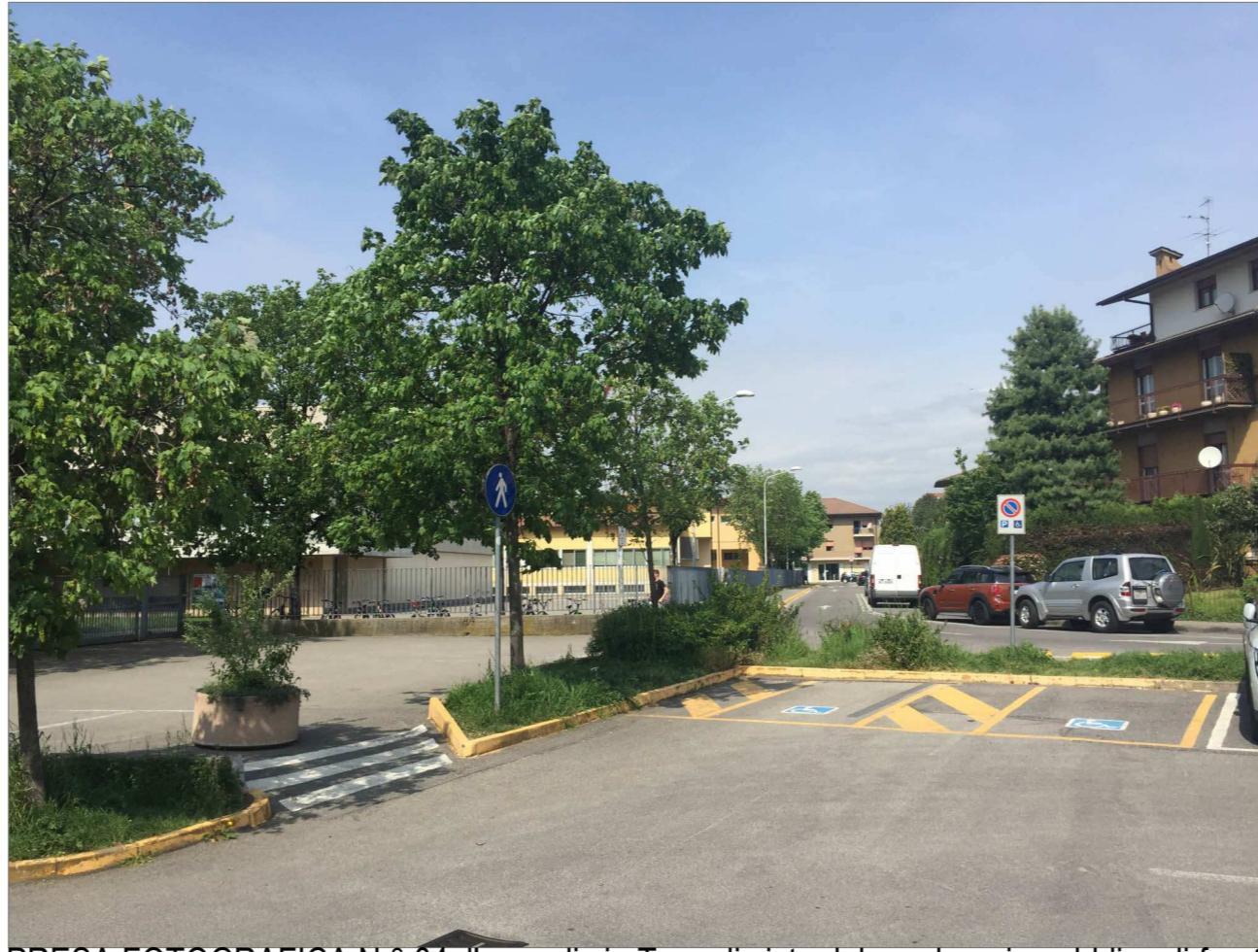
PRESA FOTOGRAFICA N.° 04_l'asse di via Tognoli visto dal parcheggio pubblico di fronte al Centro Culturale comunale