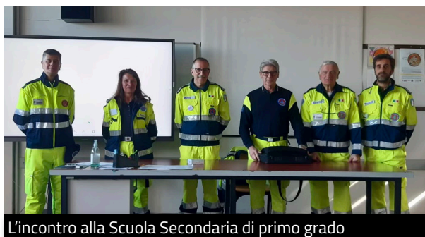
L'incontro alla Scuola Secondaria di primo grado

di noi volontari di Protezione Civile. Sicuramente le iniziative proseguiranno anche nei prossimi anni!