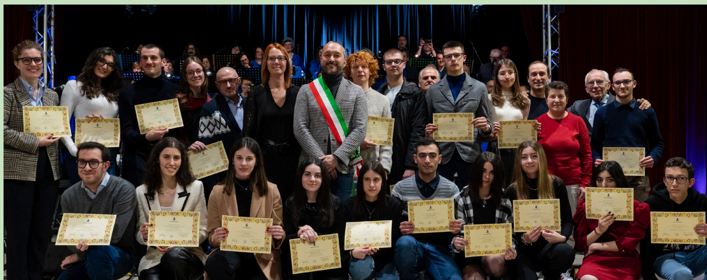
La consegna delle borse di studio durante il Concerto di Natale