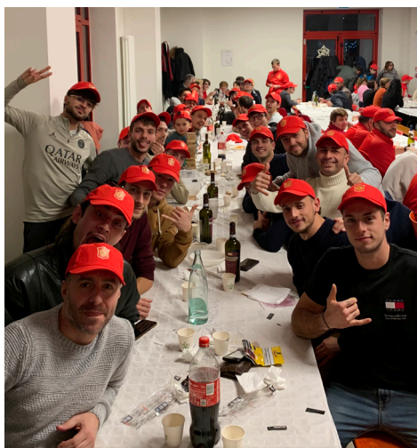
Cena dell'APD Oratorio Brusaporto

Infine, l'APD Oratorio Brusaporto ha organizzato una cena con tutti i giocatori, dai più piccoli ai più grandi, e le loro famiglie, per un campionato di ritorno ancora più bello!