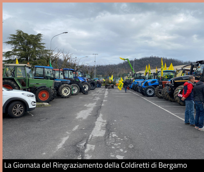
La Giornata del Ringraziamento della Coldiretti di Bergamo

Complimenti a tutti per l'organizzazione, in particolare alla Coldiretti di Bergamo, e a tutti i partecipanti!