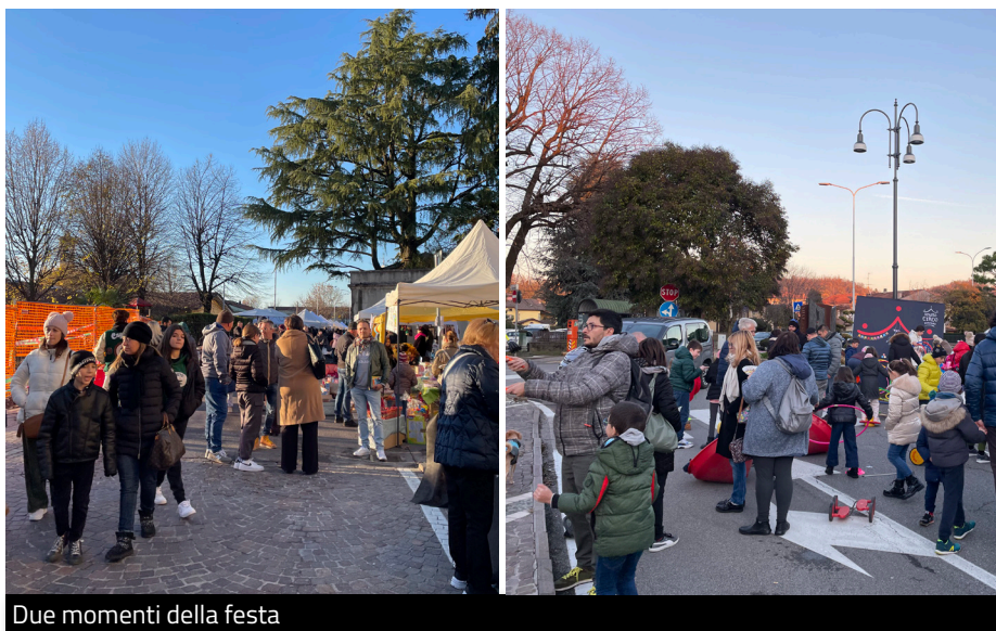
Due momenti della festa

Domenica 4 dicembre 2023 si sono svolti i classici "Mercatini di Natale", che quest'anno hanno occupato Piazza Vittorio Veneto e le vie limitrofe. Tanti stand tra hobbisti, associazioni, attività commerciali, ambulanti. Durante la giornata i bambini hanno potuto divertirsi sui gonfiabili offerti gratuitamente dalla Farmacia di Brusaporto, che ringraziamo, oltre all'animazione di clown, giocolieri e Babbo Natale! Nel pomeriggio la banda dell'Associazione Amici della Musica ha allietato la giornata con brani della tradizione natalizia, itineranti nel mercatino. Infine, per terminare alla grande, il ristorante Da Vittorio e l'enoteca 4R hanno omaggiato i partecipanti di dolci e vino. Un grazie a tutti coloro che hanno reso magica la giornata, soprattutto ai volontari e agli operai!