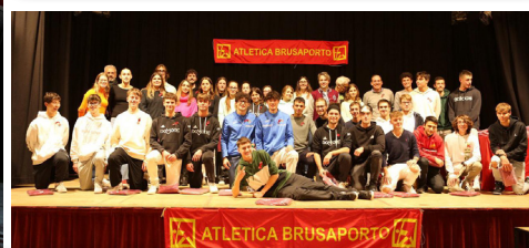
Festa di fine anno dell'ASD Atletica Brusaporto