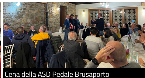
Cena della ASD Pedale Brusaporto