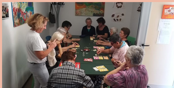
Un momento del servizio di prossimità "L'Altro Caffè"