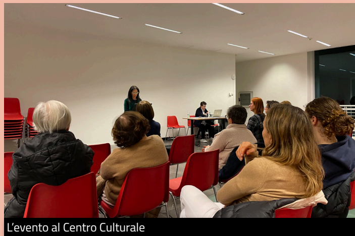
L'evento al Centro Culturale

Quest'anno l'Assessorato alle Pari Opportunità ha scelto di valorizzare una realtà del territorio accogliendo la proposta arrivata dalla compagnia teatrale "I Fuori Scena" di Brusaporto che hanno presentato quattro letture, alternate a musiche, tratte dal libro: "Ritratti di Donne" di Sara Rattaro, che narrano momenti importanti della vita di donne straordinarie, capaci di lottare per i propri sogni e la propria libertà. La serata è risultata profonda e al tempo stesso piacevole, grazie anche al pubblico intervenuto.