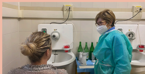
Il servizio di inalazioni con acqua termale

Per tutte le informazioni, è possibile consultare le schede descrittive dei servizi sul sito del Comune oppure scrivere una email all'indirizzo antonella.laudadio@comune.brusaporto.bg.it .