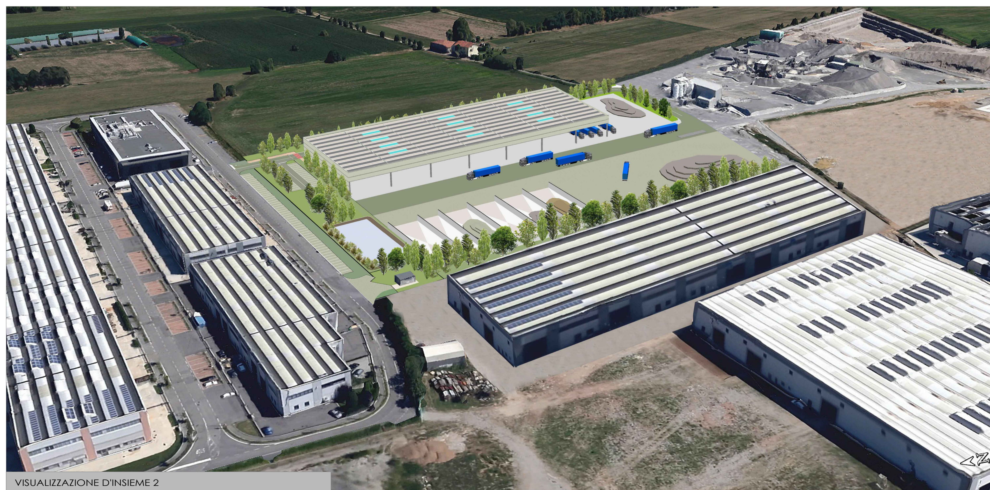
VISUALIZZAZIONE D'INSIEME 2