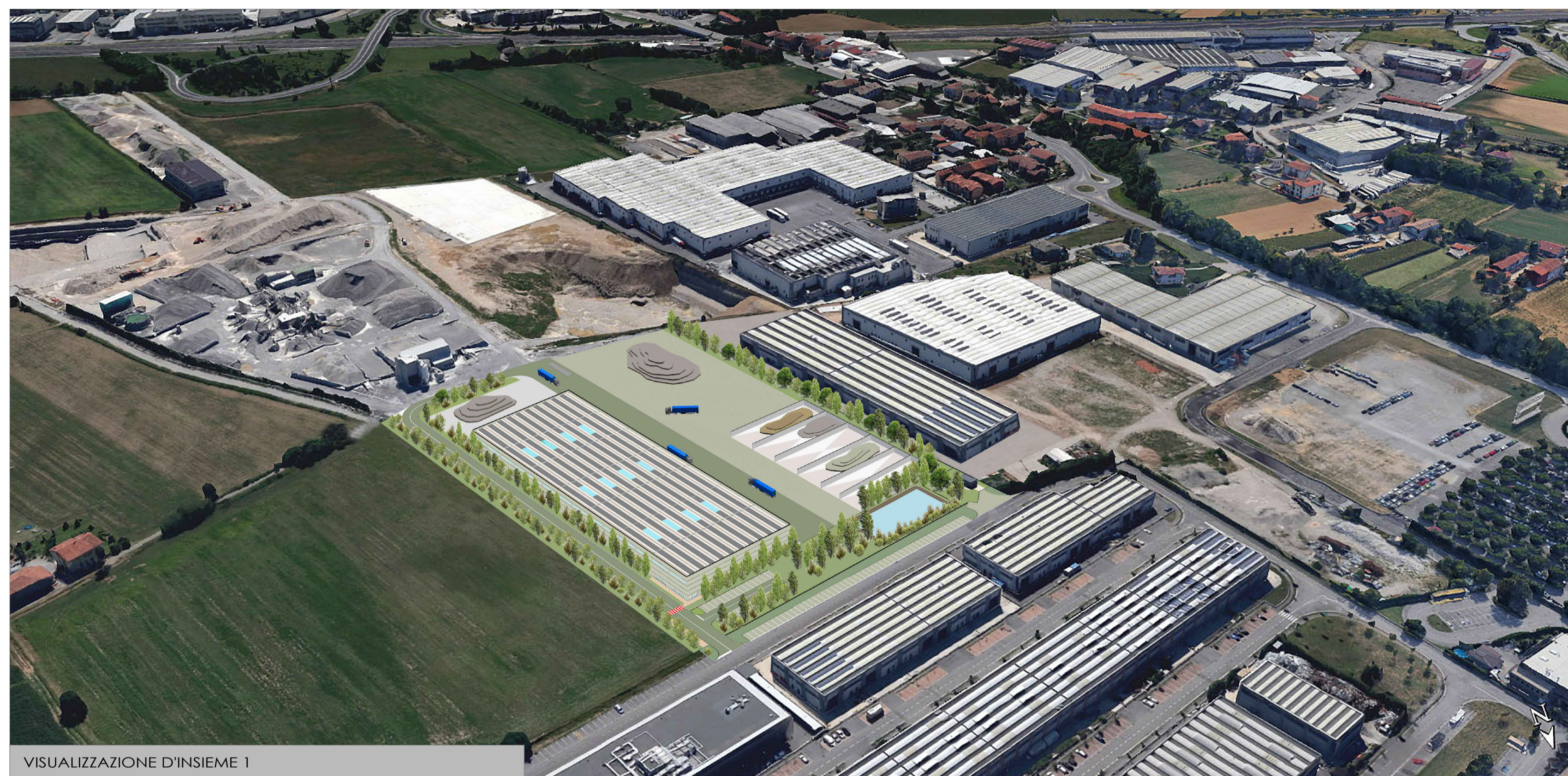
VISUALIZZAZIONE D'INSIEME 1