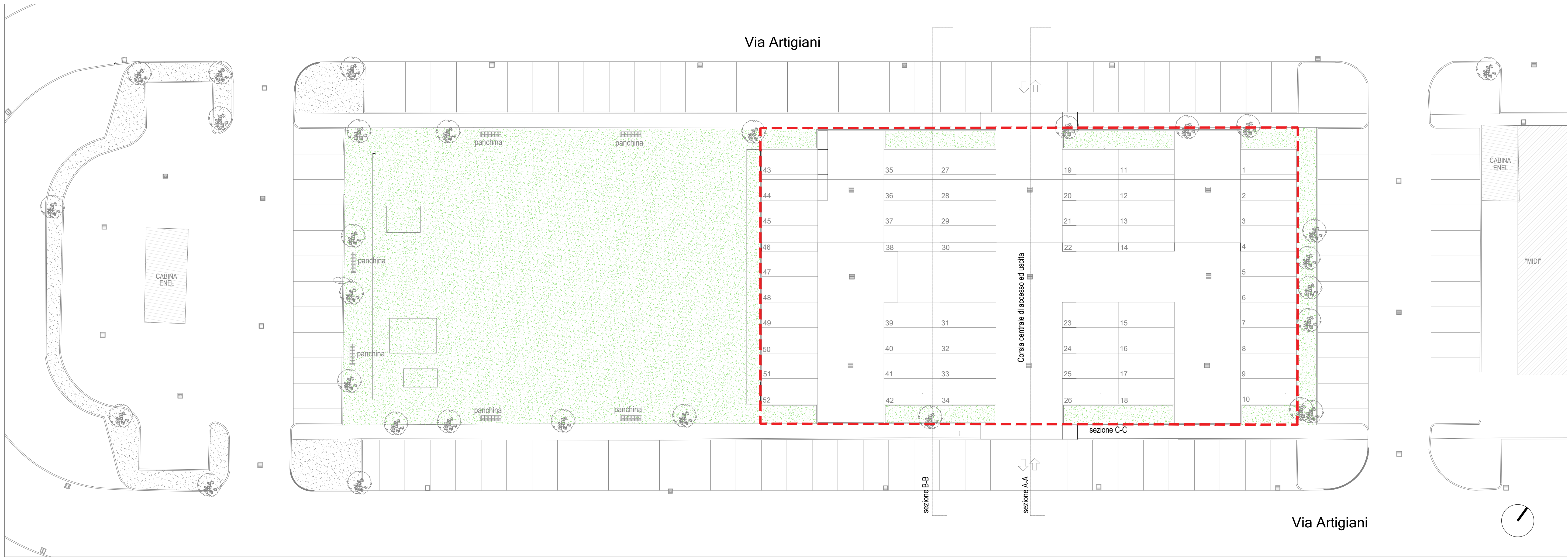
PLANIMETRIA GENERALE - AREA PER SERVIZI VIA ARTIGIANI scala 1:200