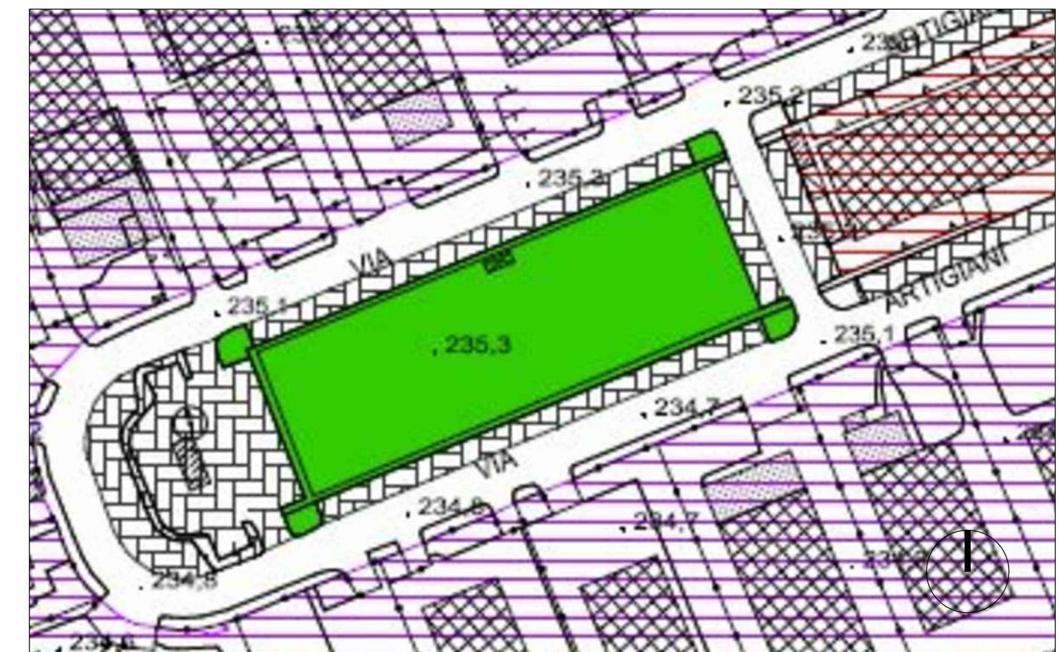
ESTRATTO VARIANTE PGT - AREA PER SERVIZI VIA ARTIGIANI scala 1:1000