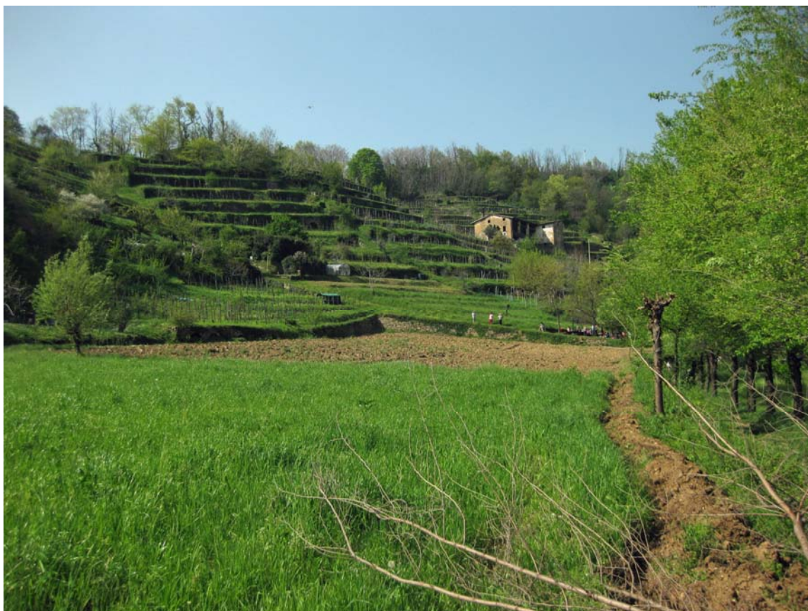
Foto 6 – Terrazzamenti a Bagnatica. Sullo sfondo Cascina Paradiso.