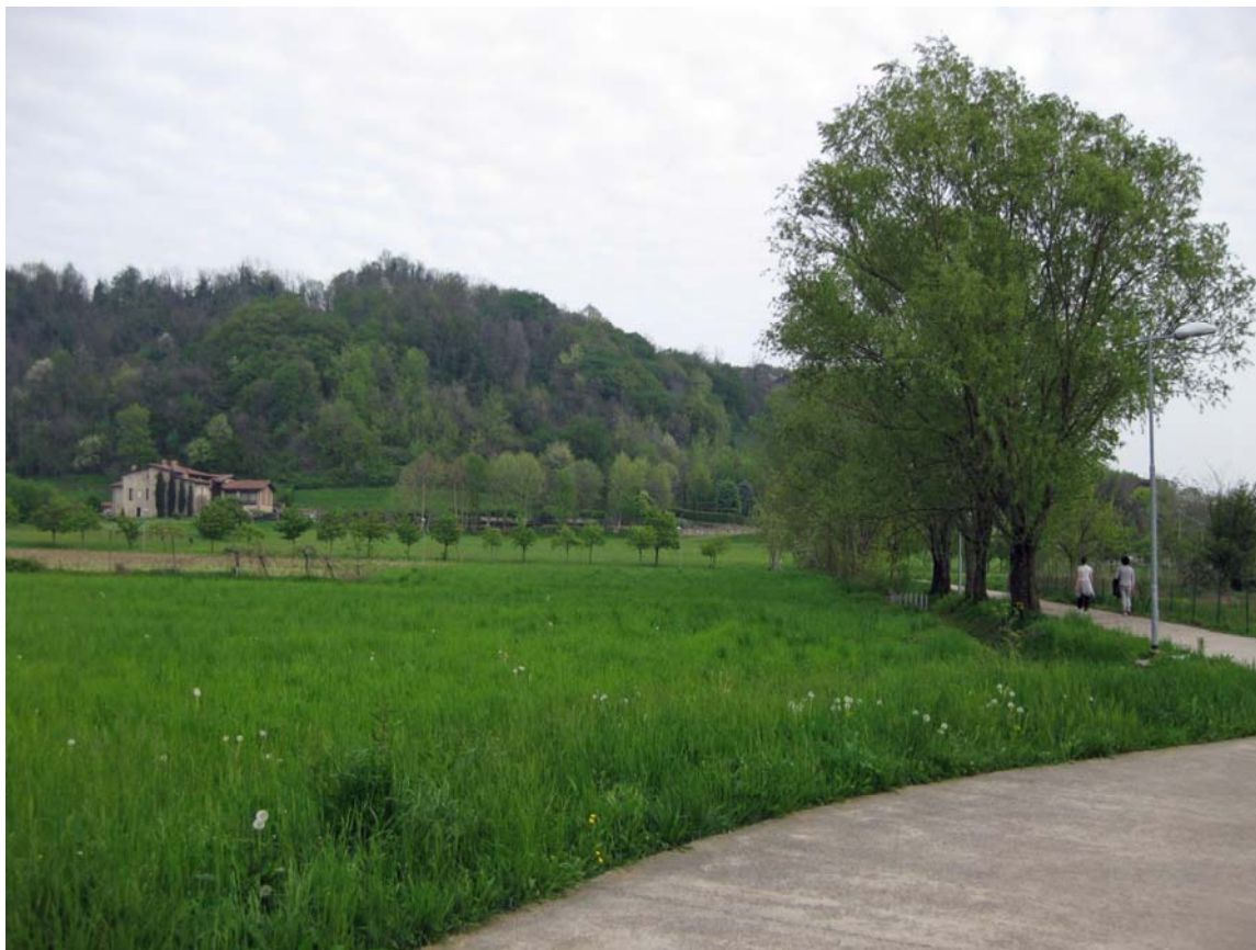
Foto 5 – Percorso ciclopedonale a Brusaporto. Sullo sfondo Cascina dei Frati.