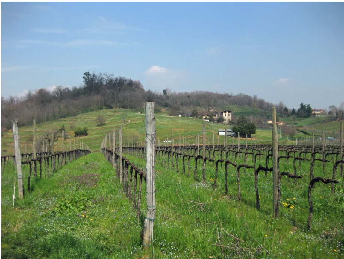
Foto - 3 Vigne a Brusaporto. Sullo sfondo Cascina Monte.