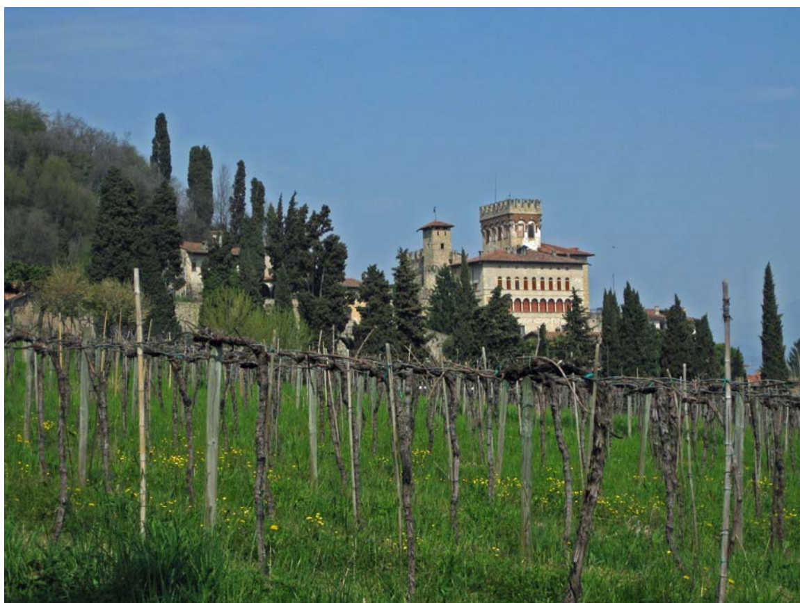
Foto 12 – Vigne a Costa di Mezzate. Sullo sfondo il Castello di Costa di Mezzate.