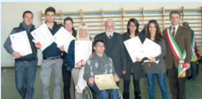
Cerimonia di consegna dei diplomi all'Istituto superiore "Lorenzo Federici".