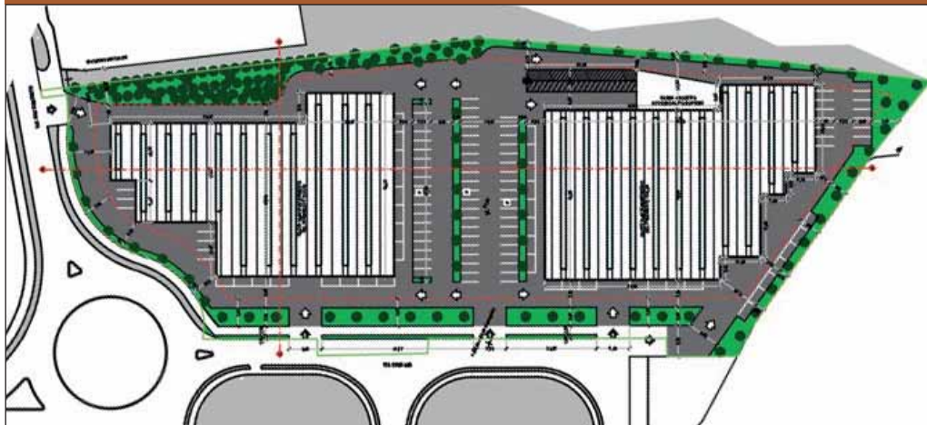
Planimetria del Piano integrato Bolgara

to a quelli obbligatori e differenziato nella natura dell'incentivo proposto, a seconda della tipologia di interventi a cui è associato. Il livello di prestazione è incentivato con misure nell'ambito della disciplina degli oneri concessori, in termini di riduzione degli oneri di urbanizzazione per gli interventi soggetti a titolo abilitativo oneroso, nonché con premi volumetrici. L'incentivo, attraverso il conse-