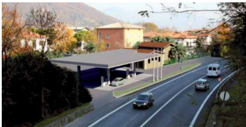
Rendering dell'impianto di distribuzione carburanti.

Sempre in materia di viabilità, anche la sistemazione