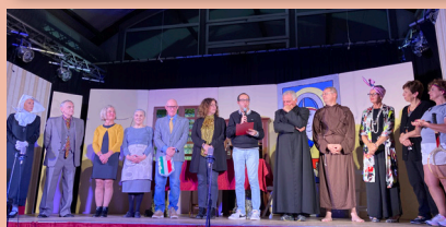
La "Compagnia de Riultela del Garda"