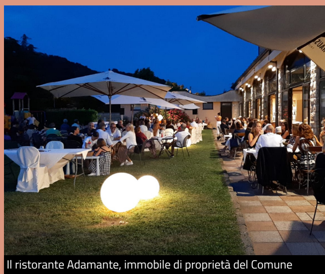
Il ristorante Adamante, immobile di proprietà del Comune

Sempre nell'ottica di un efficientamento energetico, il Comune di Brusaporto nel prossimo anno stipulerà un nuovo contratto di 17 anni con ATES, la società inhouse che gestisce il calore e l'energia; il nuovo contratto ci consentirà di investire nuove somme nella manutenzione e nel rifacimento delle centrali termiche del Centro Sportivo (bar, tennis e padel), dopo che dal 2015 ad oggi sono già state efficientate tutte le altre centrali termiche, con una gestione oculata, attenta e puntuale.