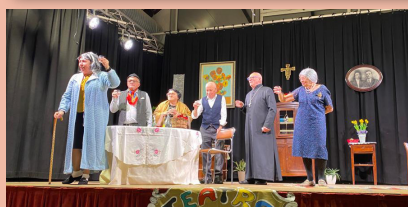
La compagnia "Teatro Comico Bergamasco"