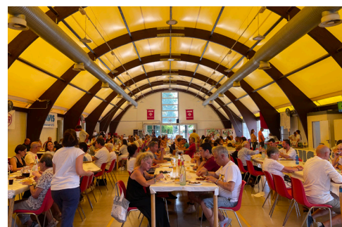
Un momento del pranzo della domenica

Tema (cover band di musica italiana), gli Animati (cover band dei Nomadi), i Babota e la musica da ballare con Tèpa. Complimenti a tutti per l'ottima riuscita della festa, con tavoli pieni e sere danzanti come non si vedeva da parecchio tempo in estate al Centro Polivalente. Speriamo che sia di buon auspicio e di stimolo per proseguire nell'organizzazione di sagre e feste sempre nuove da parte delle nostre associazioni!