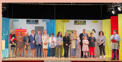
La compagnia "I Fuori Scena"

Ringraziamo tutte le compagnie teatrali che hanno portato in scena spettacoli divertenti e che hanno saputo intrattenere il sempre numeroso pubblico.