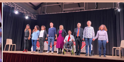
La compagnia "Quasi per caso"