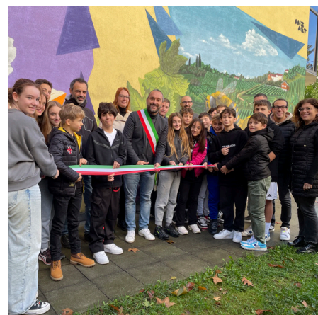
L'inaugurazione del murale