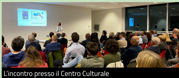
L'incontro presso il Centro Culturale