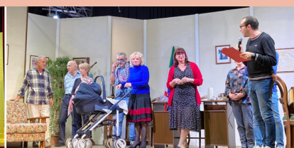
La compagnia "Sforzatica Sant'Andrea"