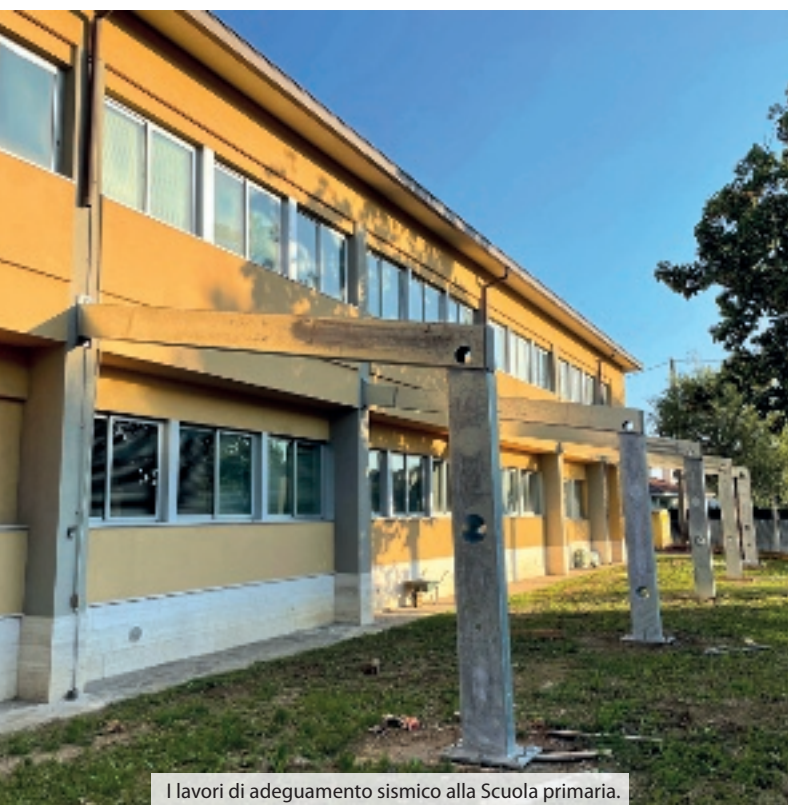
I lavori di adeguamento sismico alla Scuola primaria.