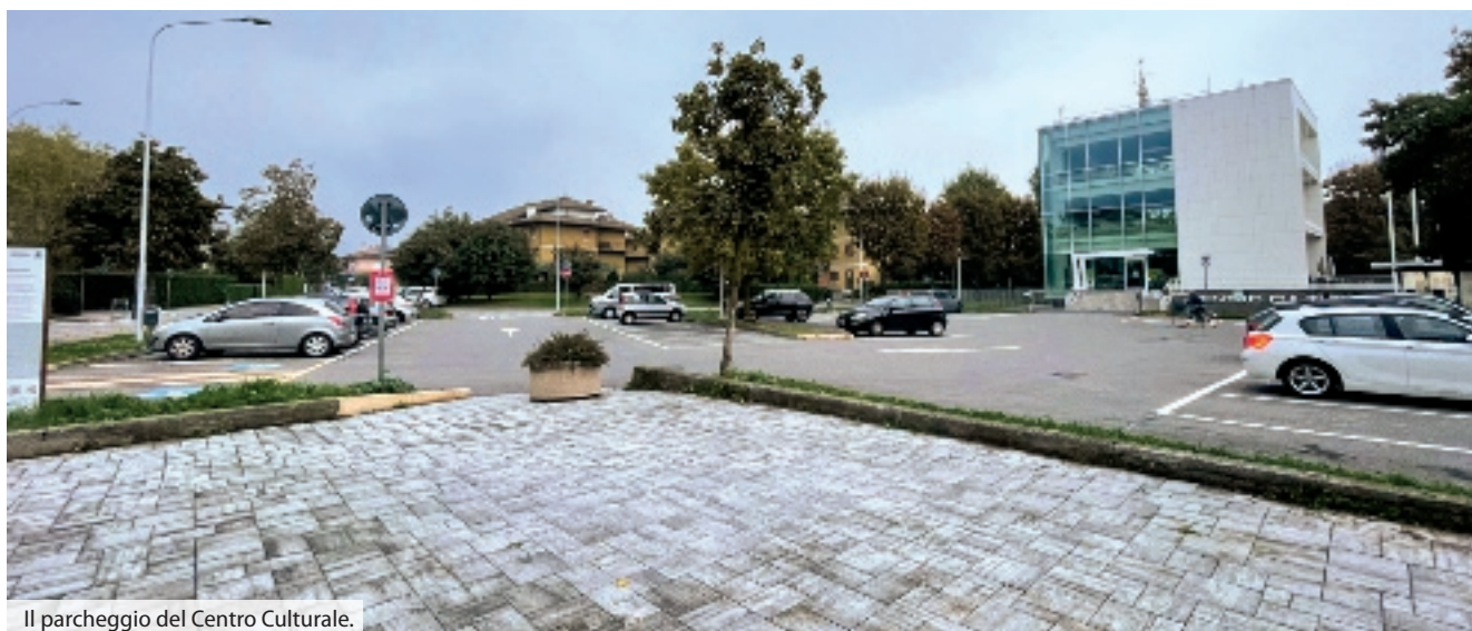
Il parcheggio del Centro Culturale.