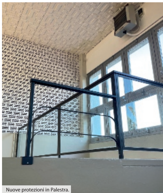
Nuove protezioni in Palestra.

Tutti questi lavori sono parte di un impegno costante per la cura, la sicurezza e il miglioramento del patrimonio pubblico a beneficio della comunità.