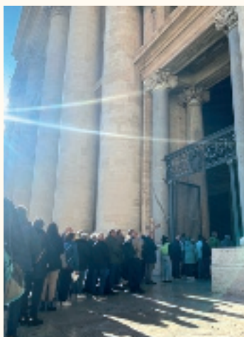
Il passaggio alla Porta Santa a Roma nel recente pellegrinaggio.