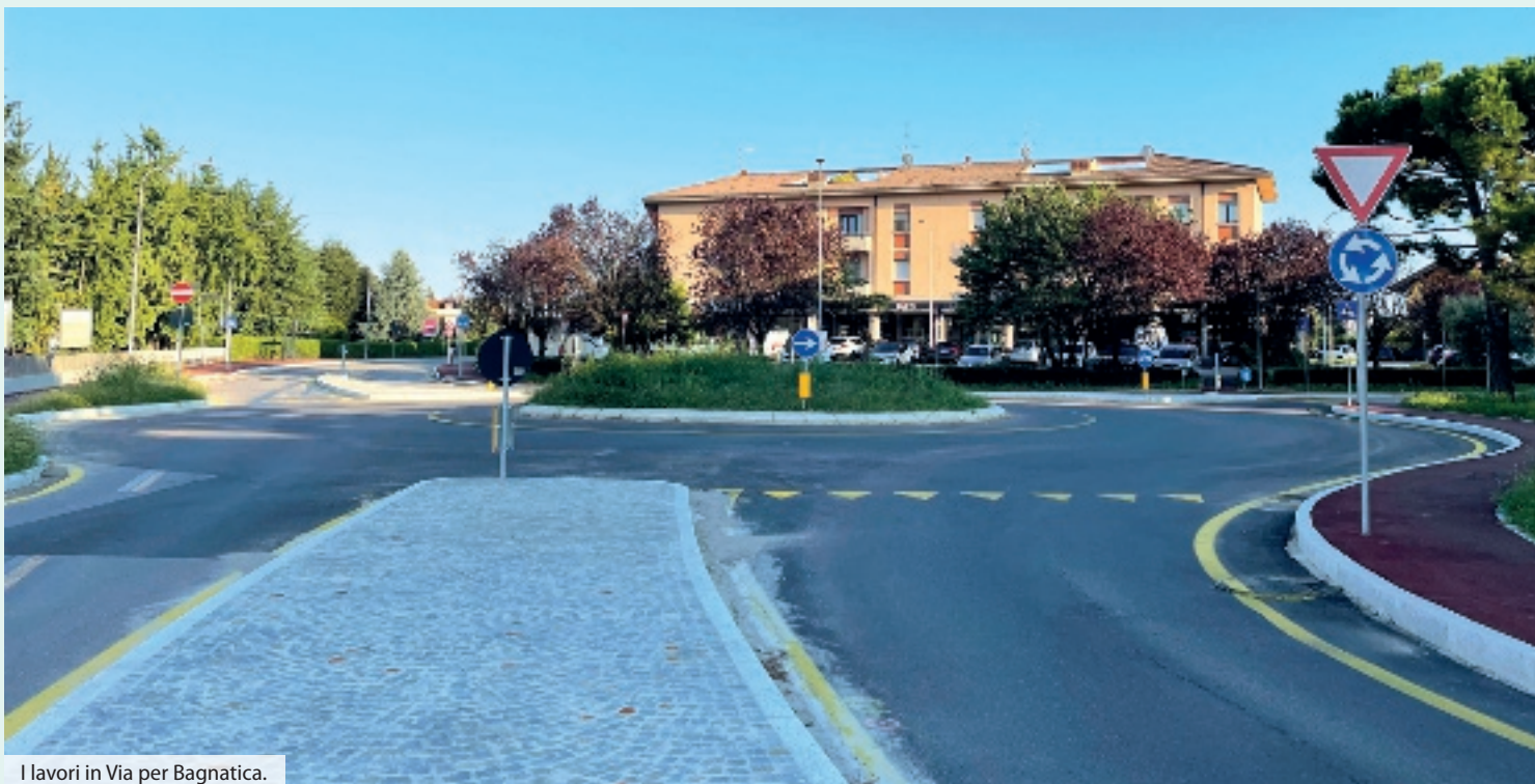
I lavori in Via per Bagnatica.

Il 24 marzo 2025 è stata convocata la prima conferenza di VAS con la messa a disposizione del Documento di scoping (Rapporto Ambientale). A seguire verrà convocata la seconda conferenza di VAS e si organizzerà un forum pubblico.